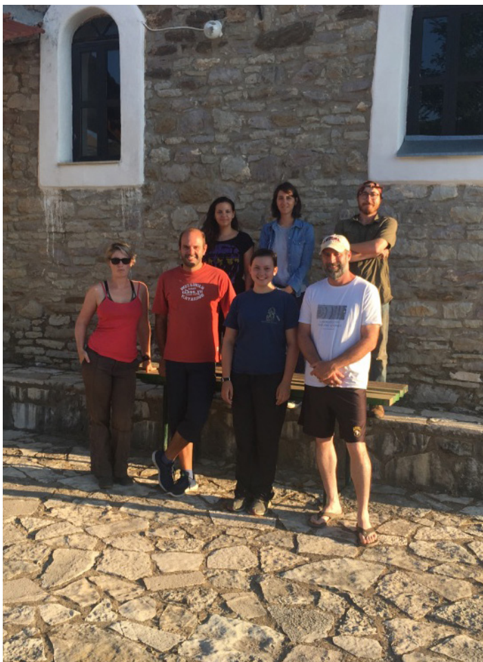
2019 Field School participants.