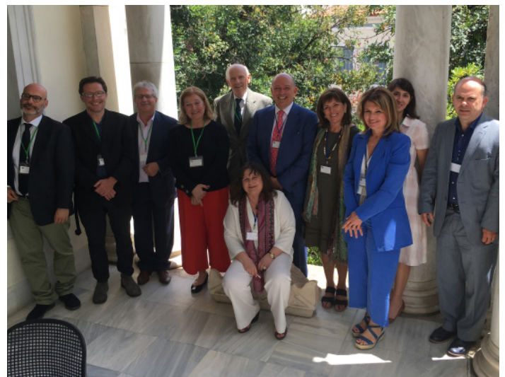
Speakers at the conference in Athens, May 31st, 2019 at Loring Hall of the American School of Classical Studies at Athens.