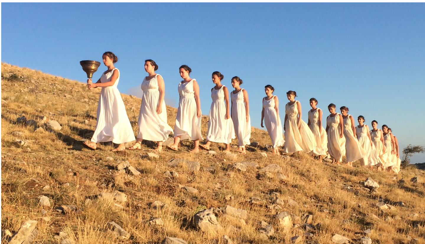
The Priestesses of Lykaion Zeus appearing at the temenos of the Sanctuary of Zeus with a lighted flame on Sunday August 13, 2017. This ceremony marks the beginning of the Modern Lykaian Games.

Μετά τους αγώνες, η κοινότητα των Άνω Καρυών και ο σύλλογος «Λύκαιος Δίας» πρόσφεραν γεύμα στην Λυκαία Πηγή για τους θεατές, τους αθλητές και τις οικογένειές τους.