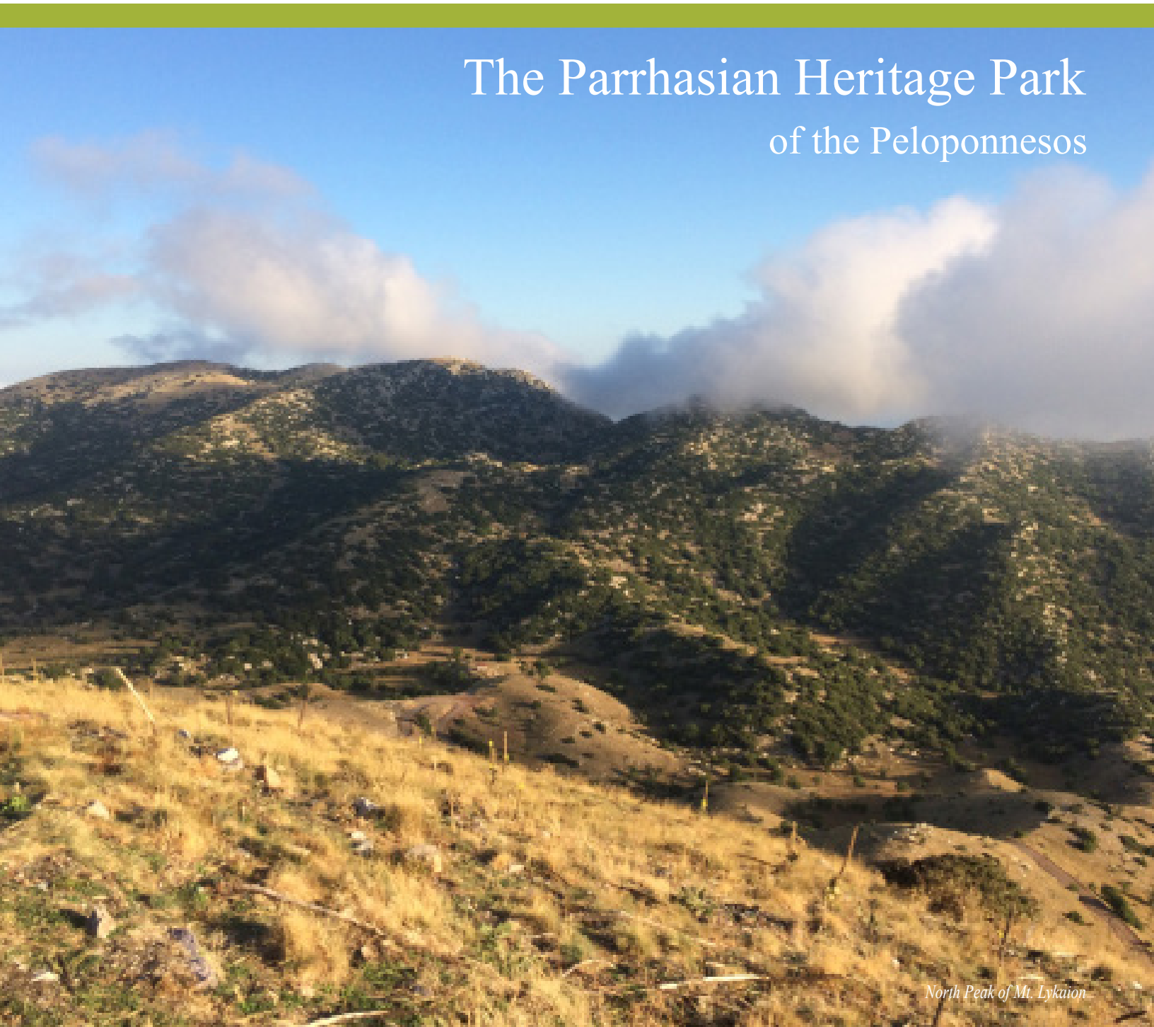
North Peak of Mt. Lykaion