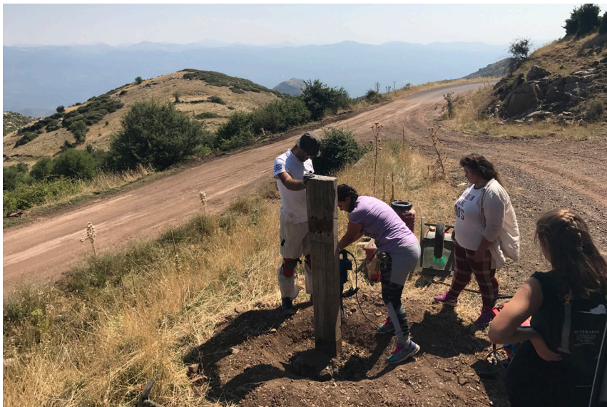
Installation of Trail of Zeus Trail Head sign at the edge of the Sanctuary of Zeus at Mt. Lykaion.