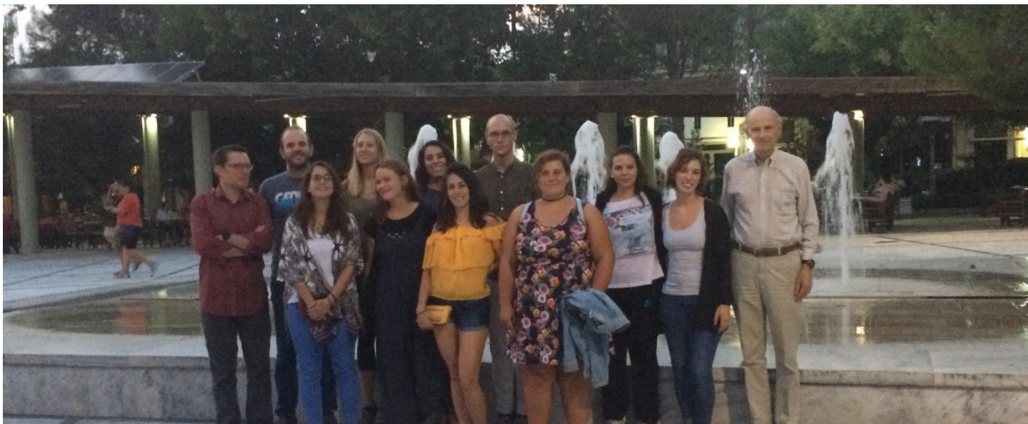
Parrhasian Heritage Park Field School 2017 in Megalopolis.