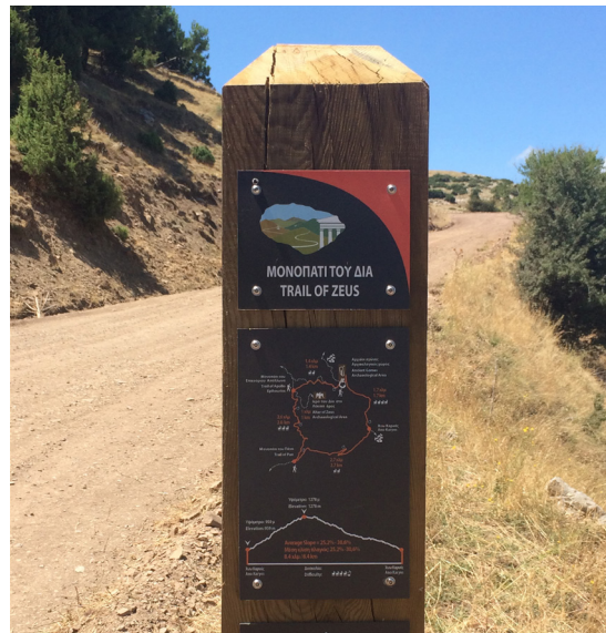
Trail of Zeus Trail Head sign.