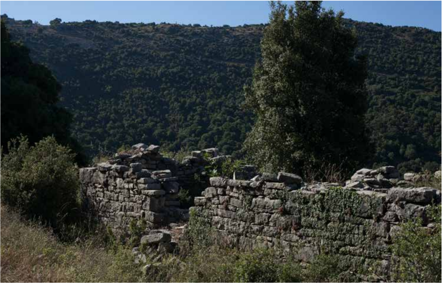
Ruins of a Christian church built on the site of the Sanctuary of Pan at Berekla.