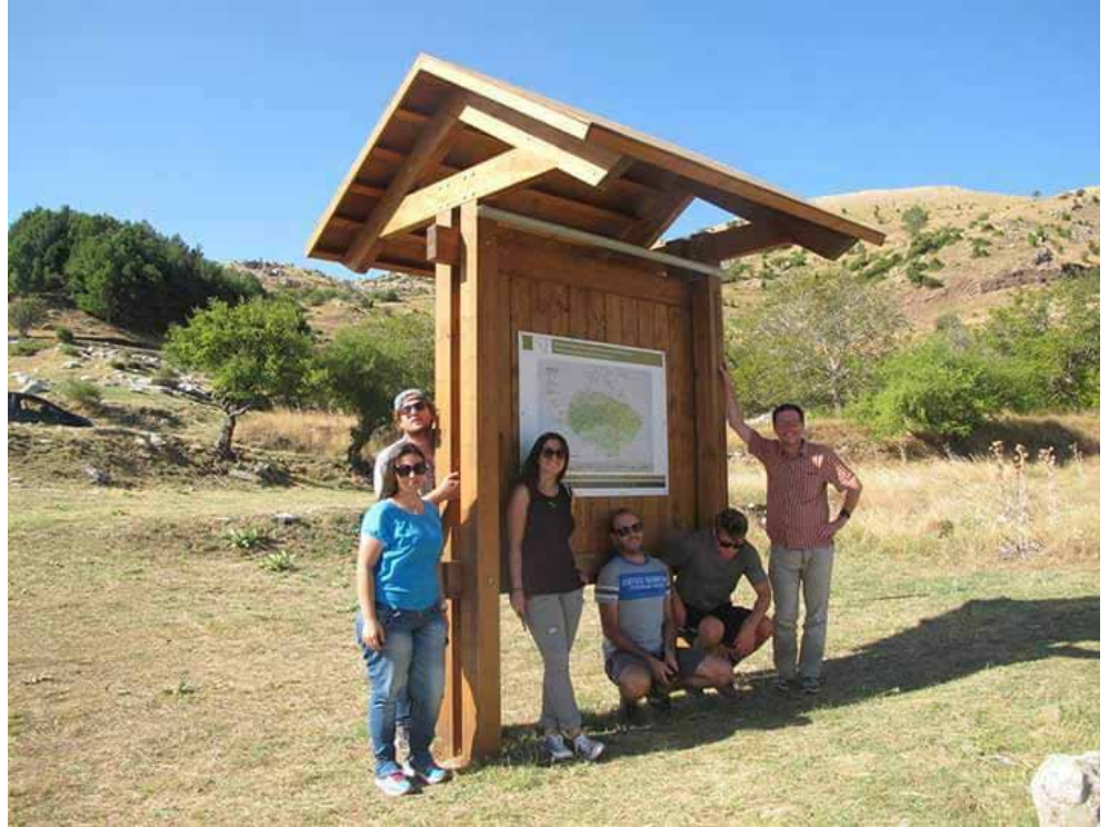
Installation of the Kiosk for the lower sanctuary near the Hippodrome. The roof was assembled and the park map and Hippodrome interpretive signs were added.

A main focus of the 2015 Field School was to finish the design of the narrative signs for the Park and to erect wooden trail head, way-finding and interpretative posts in the area of the Park immediately adjacent to the Sanctuary of Zeus at Mt. Lykaion. We were able to erect 13 trail head and way-finding signs and we have commenced the erection of a small roofed kiosk near the hippodrome at the Sanctuary of Zeus. We plan to continue the installations of posts and kiosks next summer and we also have contracted with a sign making agency in Athens to have the signs printed and ready for installation. It is our hope that the installation of signs for trails and areas of archaeological interest around Mt. Lykaion will serve as a paradigm for other parts of the Park.