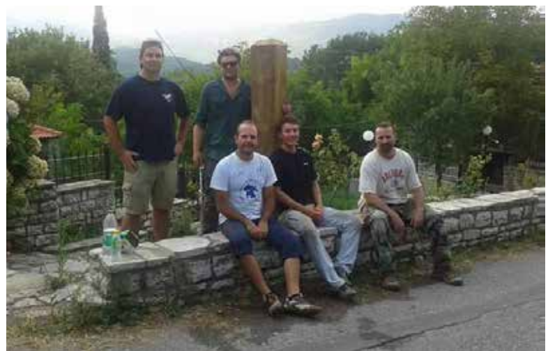
The successful installation of a trail head sign.