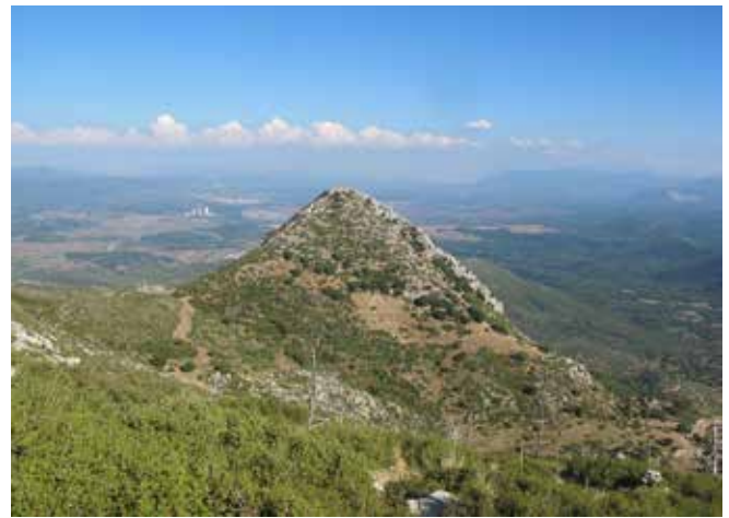
Top: Students exploring a new trail to Ayios Giorgios. Bottom left: Participants of the field school at the church to St. George. Bottom right: The peak of Ayios Giorgios.

Character assessment of the landscape is important for the understanding of the way in which trails intersect with the environment. In order to position appropriate way-finding and trail head signs, each trail must be thoroughly studied. Sometimes existing agricultural roads can be used for trails with little or no modification. Other times, trails will need to be created across an unmarked landscape. Assessments must take note of geological formations, water sources, flora and fauna, views, structures, and points of interest. Consideration of types of trees growing nearby trails: walnuts, chestnut, plane trees, and oaks were noted as they can be informative about the use of the land, climate, soil conditions, or