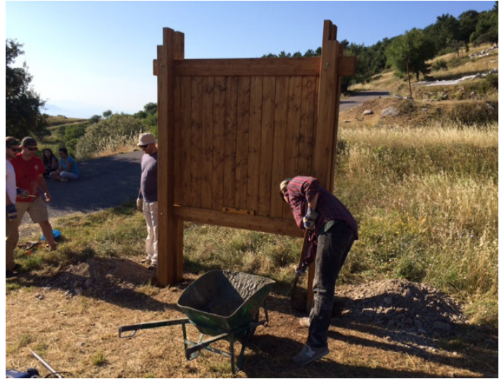
Installation of the Kiosk for the lower sanctuary near the Hippodrome. It will display a park map and an interpretive sign.