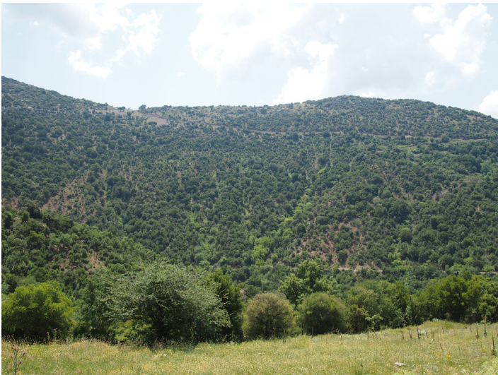
Trail of Pan on the crest of the hill, looking south.

Extensive trail identification and planning were carried out for the Trail of Pan and the Trail of Zeus, which have been under study and under construction for several years. Since signs need to be installed in and around ancient sites and sanctuaries it is important that the trails are well marked and easily seen by the public. For this reason, a close examination of the trails was undertaken this summer to understand the needs and necessities of each of the areas. Narrative signs are planned to be set up in the villages of Ano Karyes and Neda in order to attract tourists to hike the trails and visit the neighboring archaeological sites.