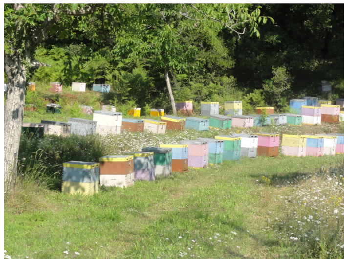
Bee boxes on the route between Neda and Ambelliona