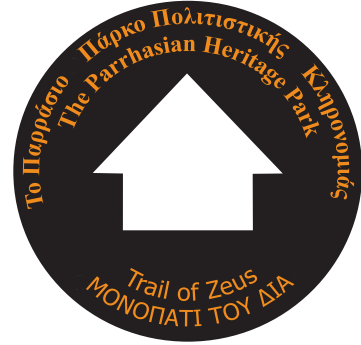
Top Left: Lauren Dreyfuss and Pat Playdon set a post. Top Right: An example of a way-finding arrow that will be placed on the smaller posts along trails. Bottom Left: Students carry supplies needed for post installation on the remote parts of the Trail of Zeus. Bottom Right: Kyle Mahoney and Matt Pihoker mix concrete to set a post.