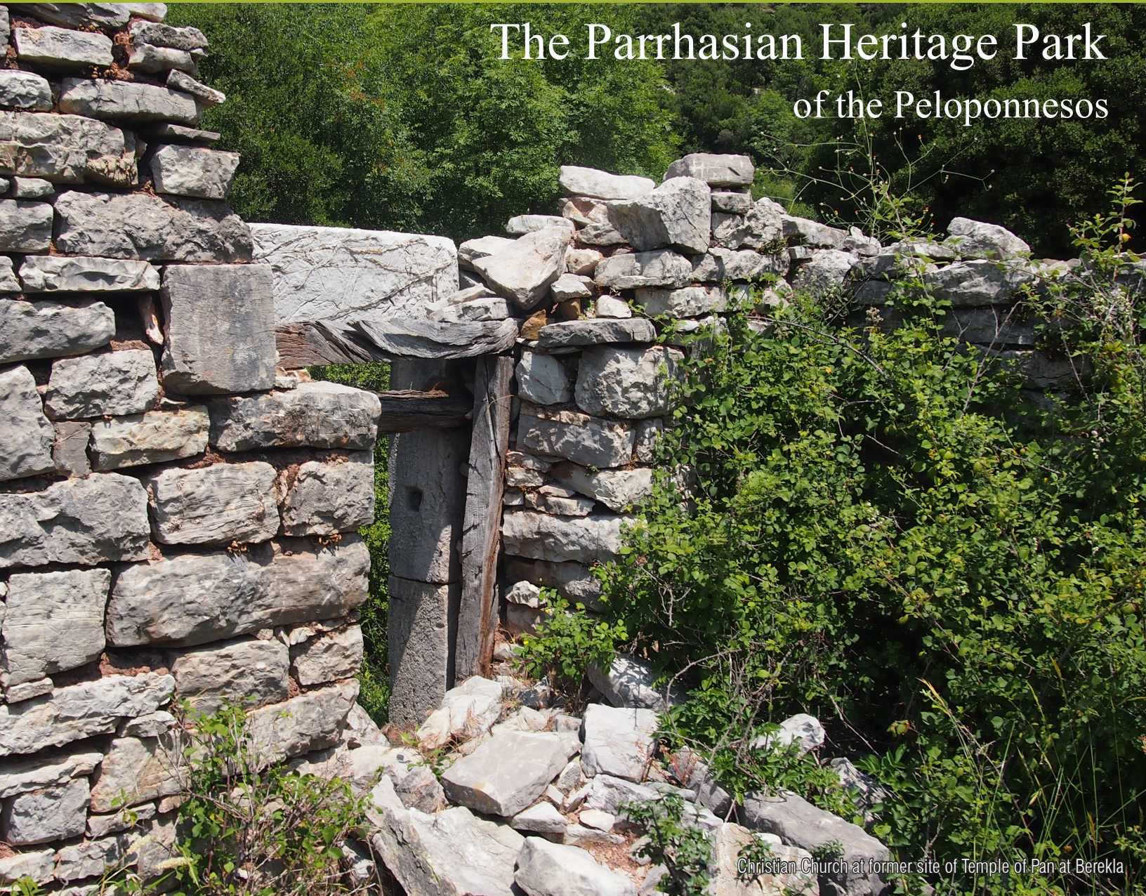
Christian Church at former site of Temple of Pan at Berekla