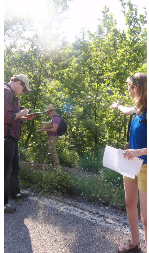
Field students log the flora and fauna that distinguish the Neda Valley character area.

Character assessment of the landscape is important for the understanding of the way in which trails intersect with the environment. In order to position appropriate way-finding and trail head signs, each trail must be thoroughly studied. Sometimes existing agricultural roads can be used for trails with little or no modification. Other times, trails will need to be created across an unmarked landscape. Assessments must take note of geological formations, water sources, flora and fauna, views, structures, and points of interest. Consideration of types of trees growing nearby trails: walnuts, chestnut, plane trees, and oaks were noted as they can be informative about the use of the land, climate, soil conditions, or water flow. The current use of the land for agricultural purposes is an important part of the landscape character study.