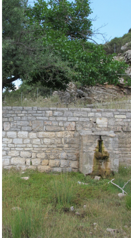
A fountain is found along the trail of Zeus.