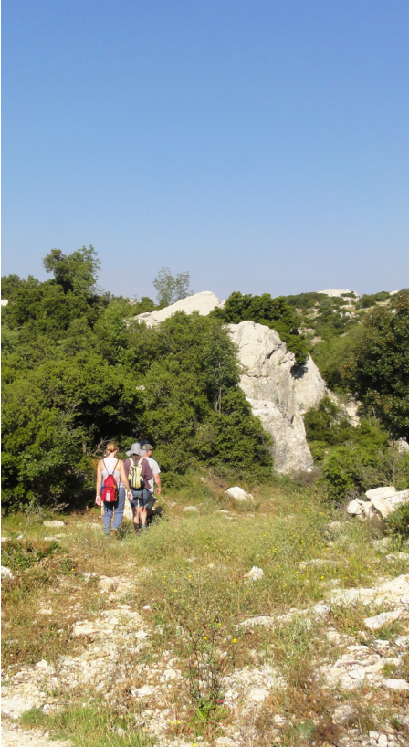
Field students hike the Trail of Zeus to record the path and mark points of confusion.