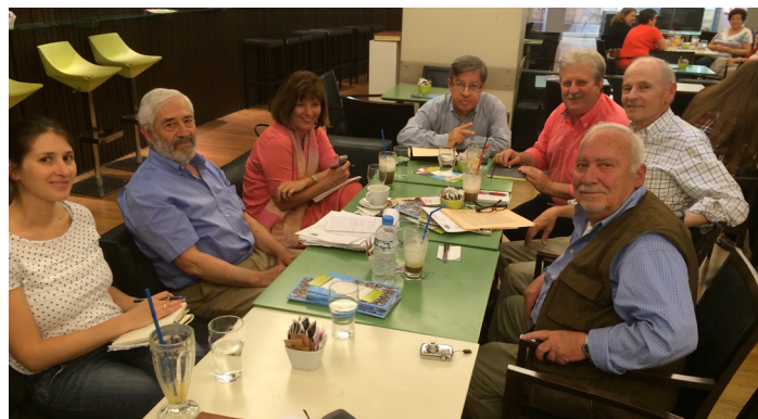
Joint meeting between Parrhasian Heritage Park Society and the Parrhasian Heritage Foundation