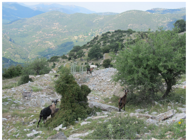
Character and trail assessment of a possible route from Neda to Ambelliona with omnipresent goats.