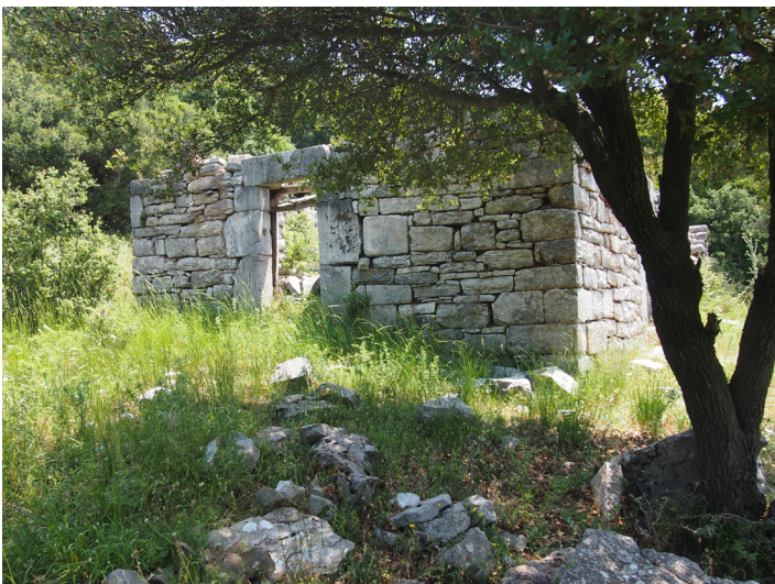
Trail Assessment and planning for a portion of the Berekla Trail. Access to Temple of Pan at Berekla was recorded.