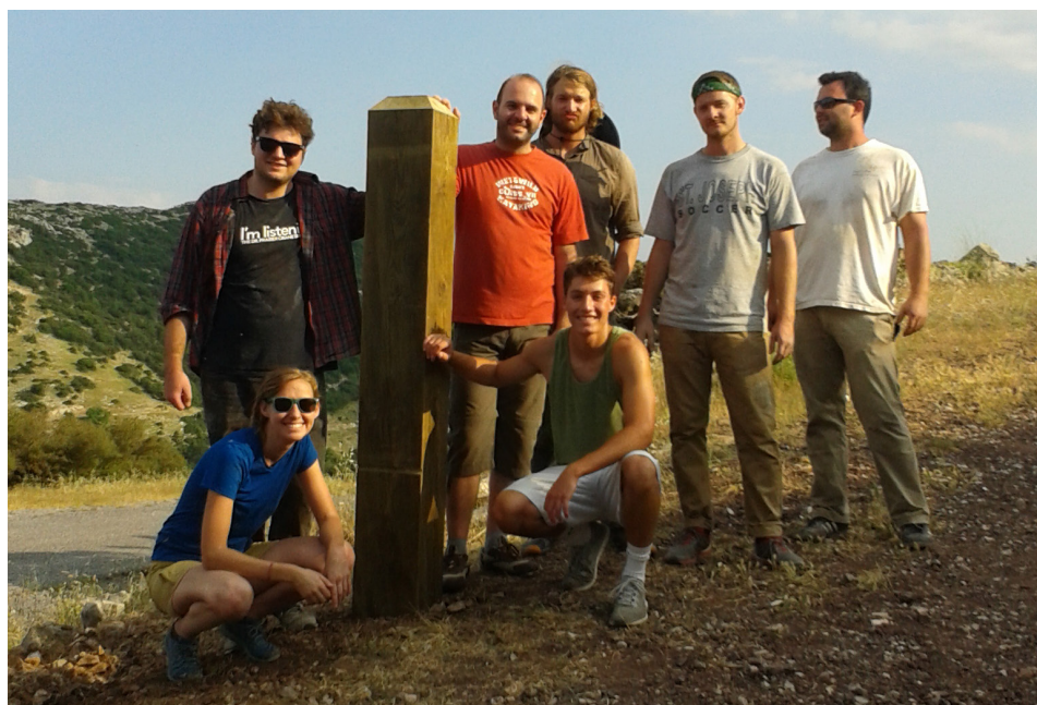
Above: Field School Participants with the finished installation of a large trail head post. This particular post will hold the three piece trail map for the Trail of Pan (left). Each Trail head will have one of these maps to let visitors know which trail they are on and the specific attributes of it.